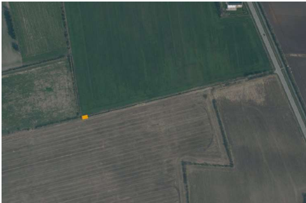
Skitse af rørlægningen, på flyfoto fra foråret 2019.

Lokaliteten ligger ved Varde Hovedvej 25, nær Ribe.